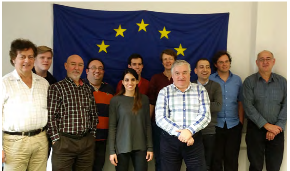
Erstes Treffen des Projektkonsortiums im Februar 2016 in Hannover

Die Ergebnisse des v-UPGRATeS Projekts werden in 16 Multiplikatoren-Veranstaltungen verbreitet. Zielgruppen sind LehrerInnen, SchülerInnen, TrainerInnen in der Aus- und Fortbildung, politische EntscheidungsträgerInnen sowie die interessierte Öffentlichkeit.